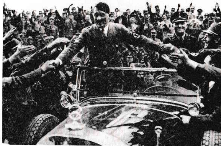
Hitler i-a fost prezentat poporului german drept un om cu puteri mistice, supranaturale, capabil să comunice cu el.

Hitler a început să studieze hipnotismul, yoga și alte discipline despre care a considerat că aveau să-i întărească voința. A încercat să miște obiecte de la distanță, concentrându-și voința asupra exercițiului, a încercat să detecteze apă prin pădurile din jurul Vienei. Hitler a studiat astrologia, învățând cum să elaboreze un horoscop. A studiat și numerologia, grafologia, adică evaluarea caracterului unei persoane pe baza scrisului de mână, precum și fiziognomia, adică arta de a judeca oamenii după chipul și limbajul corporal. Hitler a încercat uneori să își testeze forța voinței ținându-și mâna sub un jet de gaze arzând. Faptul că Greiner i-a prezentat lui Hitler mai multe practici oculte este confirmat de alții care l-au cunoscut în perioada respectivă, cu precădere Reinhold Hanisch, care, asemenea lui Greiner, a fost prietenul lui prin diverse aziluri de noapte din Viena.